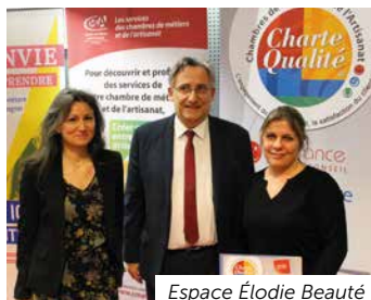
Espace Élodie Beauté