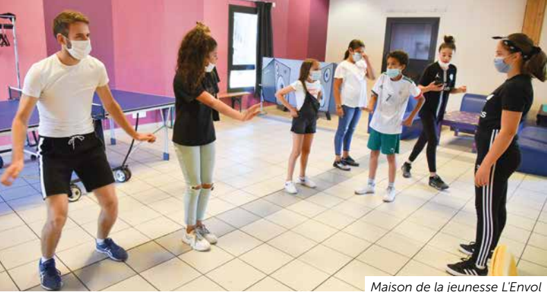
Maison de la jeunesse L'Envol