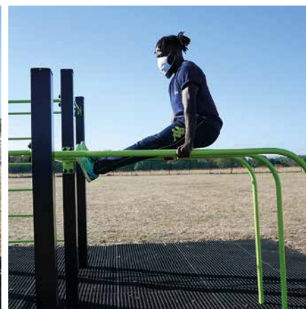
Le choix des agrès s'est porté sur des appareils permettant de travailler plusieurs parties du haut comme du bas du corps en toute sécurité.