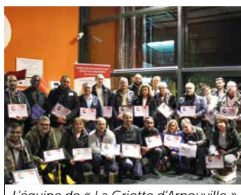
L'équipe de « La Griotte d'Arnouville »