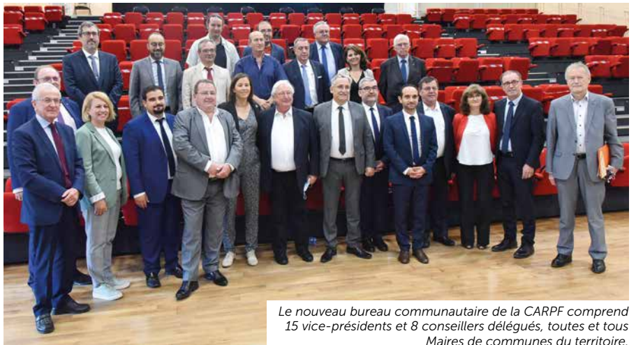
Le nouveau bureau communautaire de la CARPF comprend 15 vice-présidents et 8 conseillers délégués, toutes et tous Maires de communes du territoire.