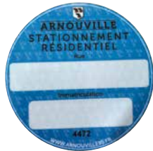
Les premières vignettes ont été distribuées aux habitants des rues passées en zone bleue.

Je ne suis pas riverain de l'une des rues transformée en zone bleue : • Je peux désormais stationner dans l'une des rues concernées par le passage en zone bleue pour une durée de 1h30 en apposant un disque de stationnement réglementaire.