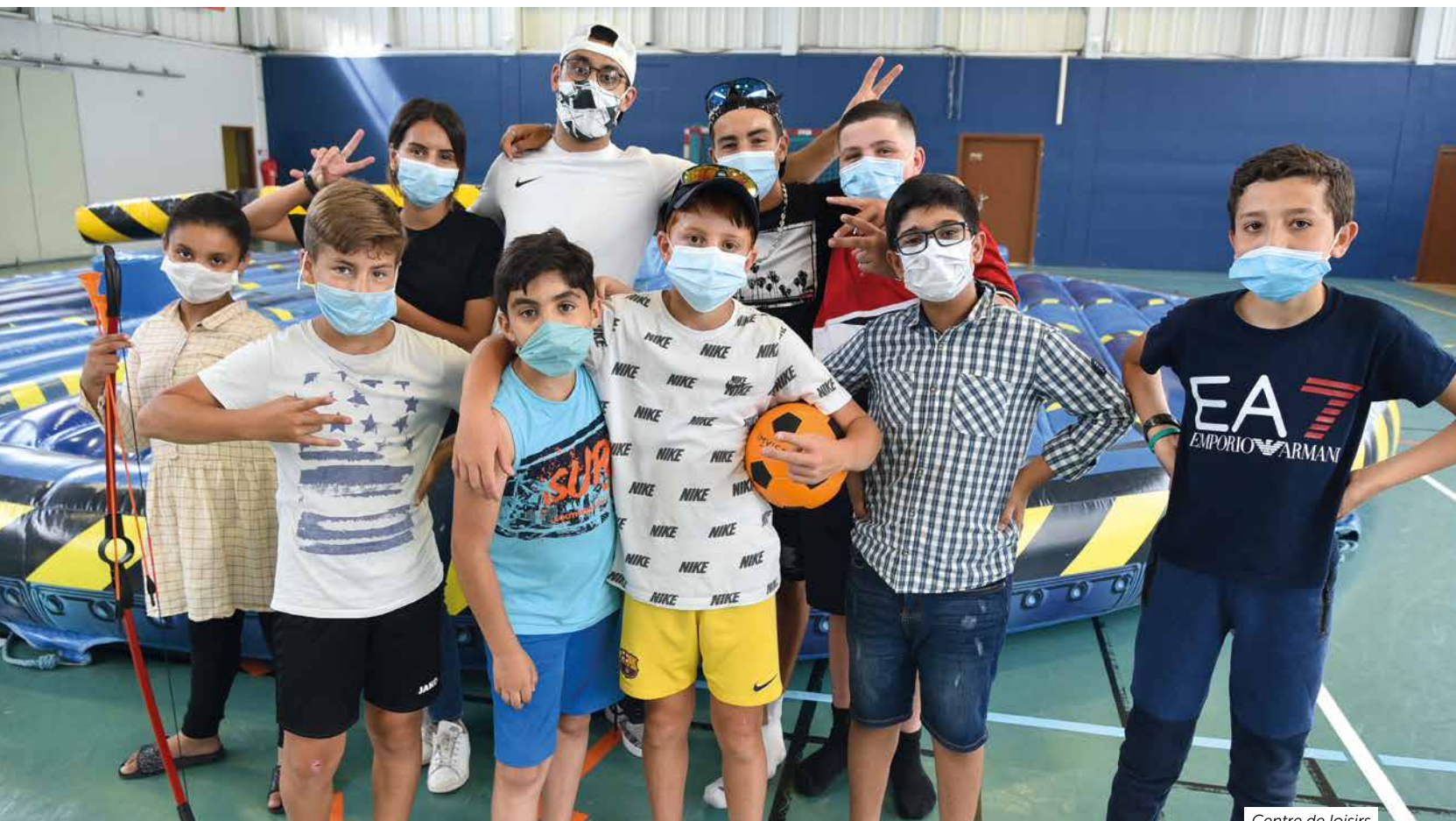
Centre de loisirs