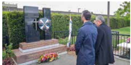
Commemoration du génocide Assyro-Chaldéen