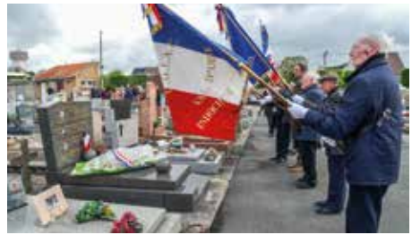
Commemoration de la Déportation