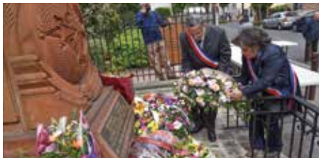
Commemoration du Génocide Arménien