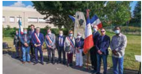
Commemoration du 18 juin