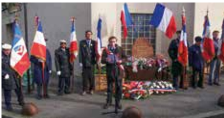
Cérémonie d'hommage à Missak Manouchian