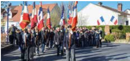
Commemoration du Cessez-le-Feu en Algérie