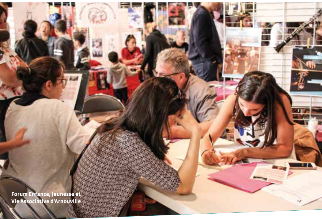
Forum Enfance, Jeunesse et Vie Associative d'Arnouville

Organisation de toute manifestation en vue de promouvoir la culture assyro-chaldéenne et de toute œuvre de bienfaisance et de service d'entraide.