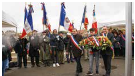
Commemoration du 11 novembre 1918 – Journée du Souvenir