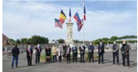
Commemoration du 8 mai 1945