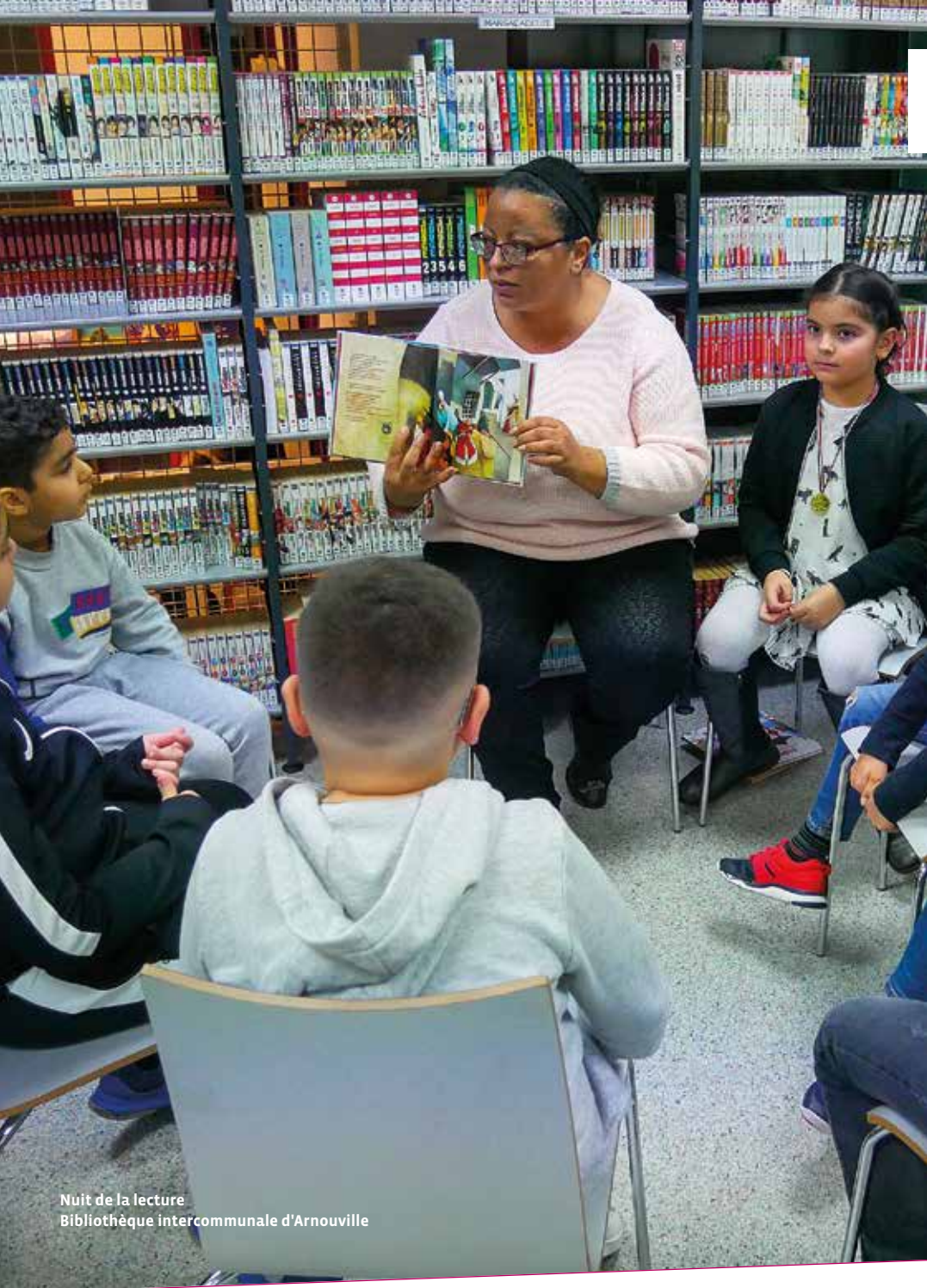
Nuit de la lecture Bibliothèque intercommunale d'Arnouville