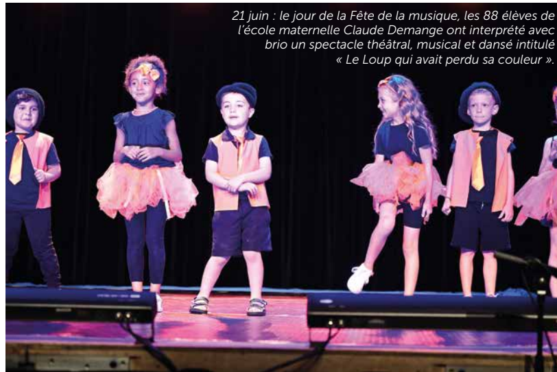
21 juin : le jour de la Fête de la musique, les 88 élèves de l'école maternelle Claude Demange ont interprété avec brio un spectacle théâtral, musical et dansé intitulé « Le Loup qui avait perdu sa couleur ».