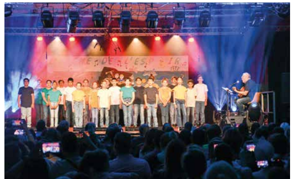
28 juin : les élèves de l'école élémentaire Victor Hugo ont offert à leurs parents et aux élus un spectacle musical intitulé « L'arche de l'espoir ».