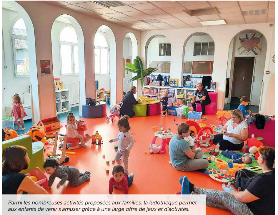
Parmi les nombreuses activités proposées aux familles, la ludothèque permet aux enfants de venir s'amuser grâce à une large offre de jeux et d'activités.

Pas de grande révolution à prévoir, mais tout de même quelques évolutions pour continuer d'aider au mieux les familles arnouilloises. En tant que centre social, Trait d'union disposerait de nouvelles subventions [voir encadré] lui permettant de pérenniser les nombreuses actions déjà engagées ; mais aussi d'en me-