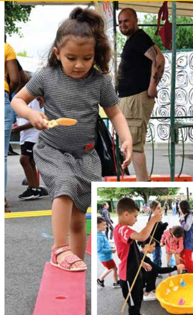
10 et 25 juin : les élèves de maternelle et d'élémentaire ont réalisé des prouesses lors des kermesses du groupe scolaire Victor Hugo !