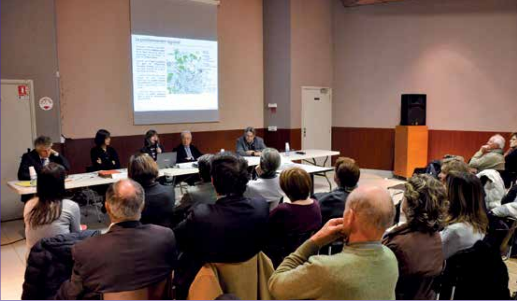
Première réunion publique de présentation de l'étude diagnostic. Soyez acteurs de l'avenir de la ville.