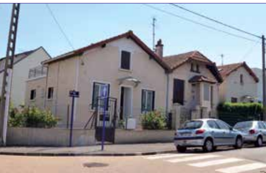
Une rue pavillonnaire. L'habitat individuel représente 71 % du nombre total de logements.

Arnouville compte environ 5 200 logements contre environ 3 950 en 1968. L'habitat se caractérise comme suit :