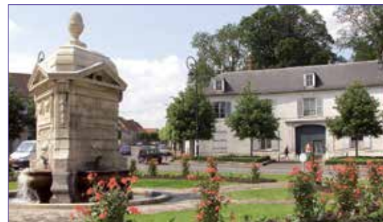
La Fontaine, symbole du patrimoine historique d'Arnouville

> Le document relatif au diagnostic et présenté lors de la réunion publique du 25 novembre 2013 est téléchargeable sur le site www.arnouville95.fr