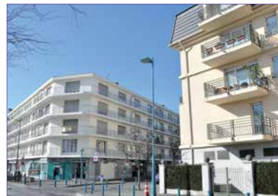
Exemple d'habitat collectif récent