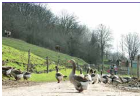
La vallée verte et La ferme Lemoine