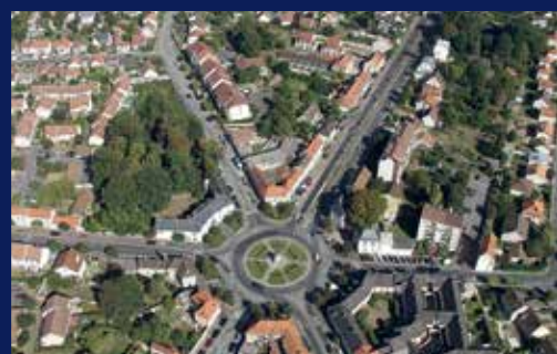
Zoom sur... Plan Local d'Urbanisme : un an de réflexion pour 15 ans d'avenir