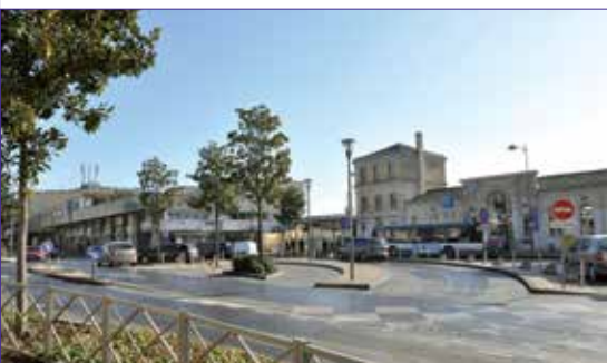
Le quartier de la gare