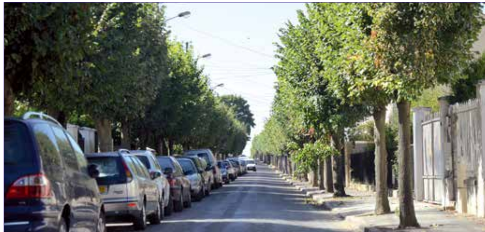
Une rue avec alignement d'arbres typique d'Arnouville. Cet ensemble de rues agrémentées d'arbres et de jardins crée une remarquable trame verte, élément central de l'identité résidentielle et pavillonnaire de la commune.