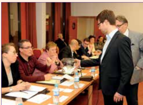
Le vote des élus : les électeurs choisissent des Conseillers municipaux qui, ensuite, élisent le Maire et les Adjoints lors de la première séance du Conseil.