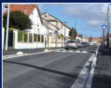
Travaux : moderniser et entretenir l'espace public