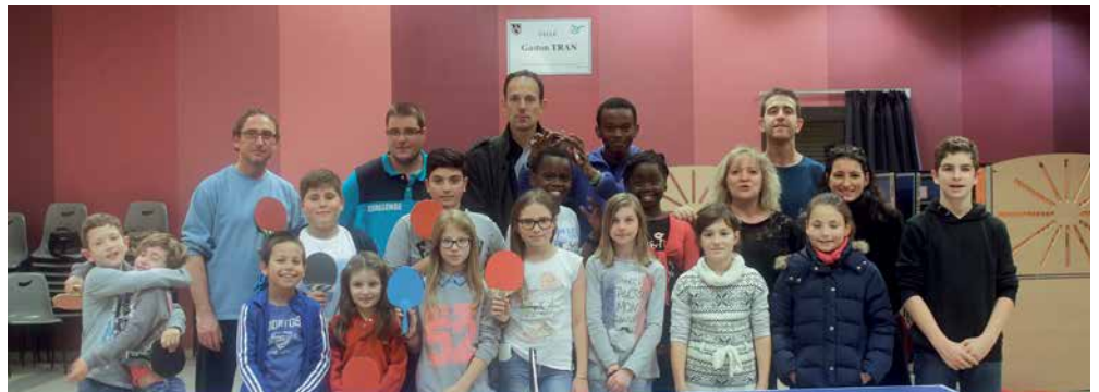
Les enfants ne manquent jamais une séance d'entraînement pour le plaisir de jouer.