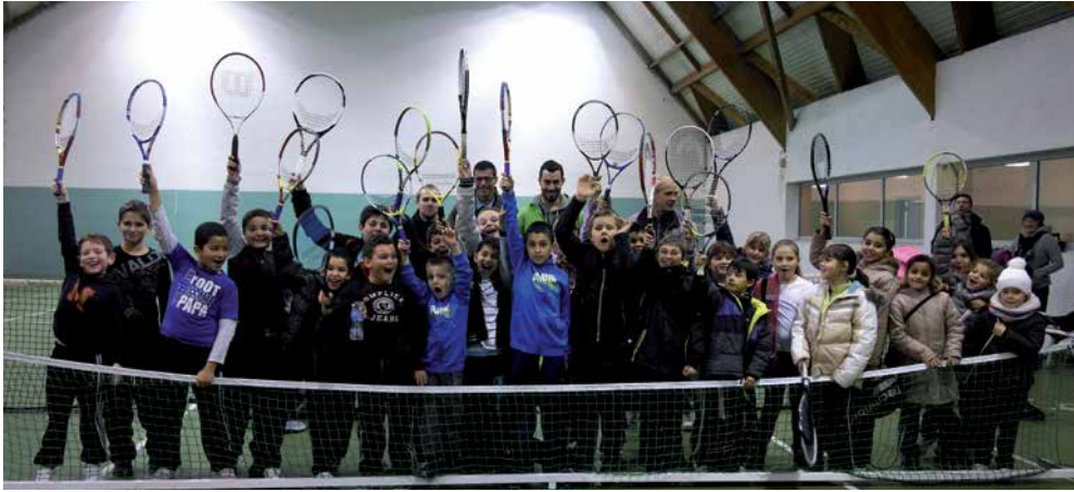
Raquettes à la main, la bonne humeur et la motivation des jeunes tennismans arnouillois font plaisir à voir!

Avec près de 200 licenciés et un beau dynamisme, le club affiche de nouvelles ambitions et de solides marges de progression. Il y a de la place pour accueillir de nouveaux joueurs dans la foulée d'une finale de coupe Davis disputée par l'équipe de France de tennis, face à la Suisse.