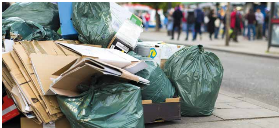
1500 € (voire plus) : c'est l'amende que risquent les personnes qui déposent des déchets dans l'espace public : encombrants, gravats, sacs-poubelles... et même les bacs jamais rentrés. Désormais, la police de l'environnement veille au grain et pourra rechercher les auteurs de ces infractions.

Règles d'urbanisme négligées, gestion des déchets de plus en plus approximative : la Ville a décidé de donner un tour de vis en constituant une Police de l'Environnement et de l'Urbanisme. Les agents formés et assermentés pourront désormais constater les infractions et sanctionner les récalcitrants aux règles du vivre ensemble.