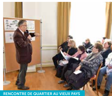
RENCONTRE DE QUARTIER AU VIEUX PAYS