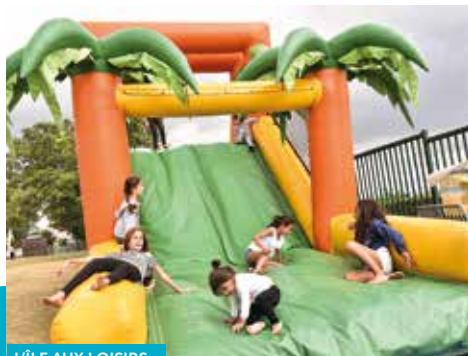
L'ÎLE AUX LOISIRS