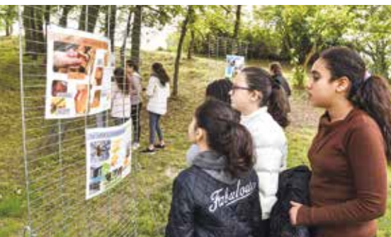
INAUGURATION DU RUCHER DU BOIS DES CONDOS