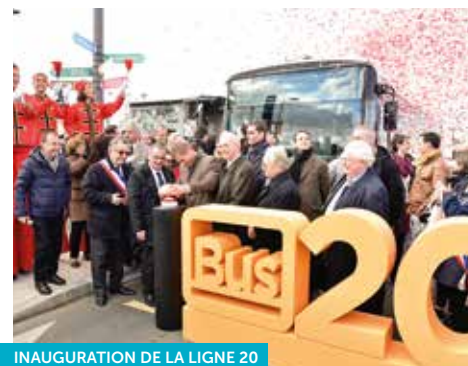
INAUGURATION DE LA LIGNE 20