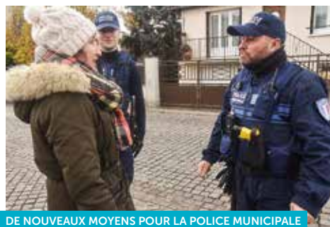
DE NOUVEAUX MOYENS POUR LA POLICE MUNICIPALE