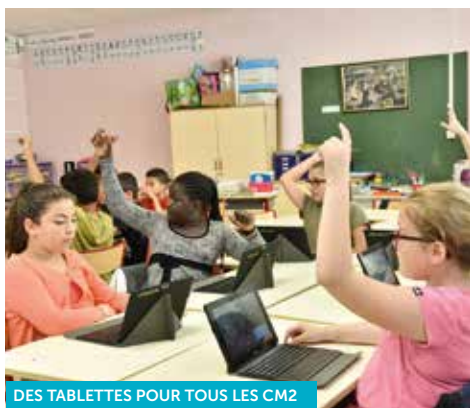
DES TABLETTES POUR TOUS LES CM2