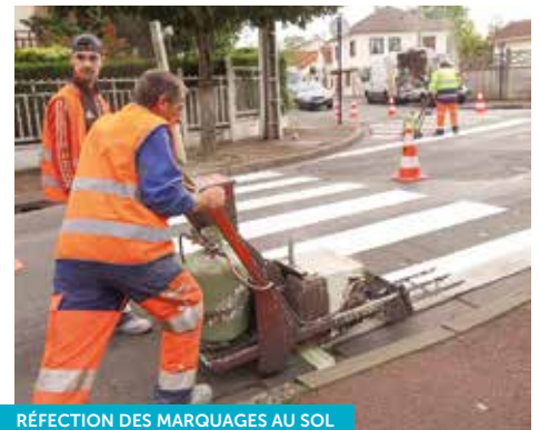
RÉFECTION DES MARQUAGES AU SOL