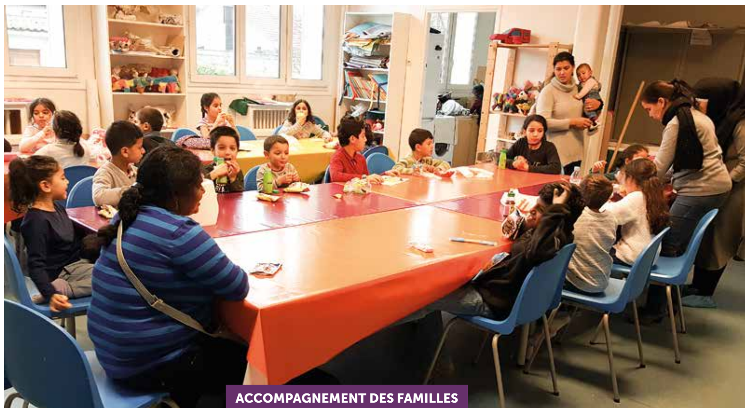
ACCOMPAGNEMENT DES FAMILLES