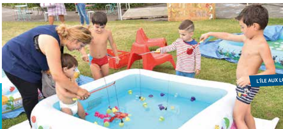
L'ÎLE AUX LOISIRS