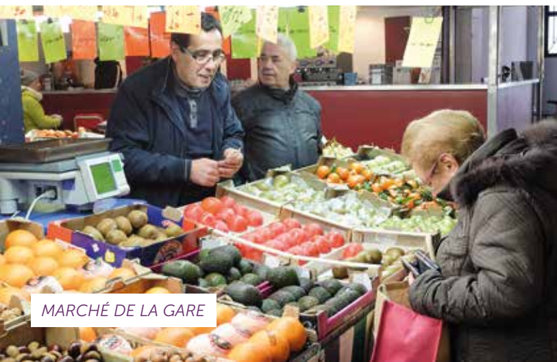
MARCHÉ DE LA GARE

55 km de canalisations 34 km pour les eaux usées 21 km pour les eaux pluviales 543 bouches d'égout ou grilles avaloirs 1 811 regards