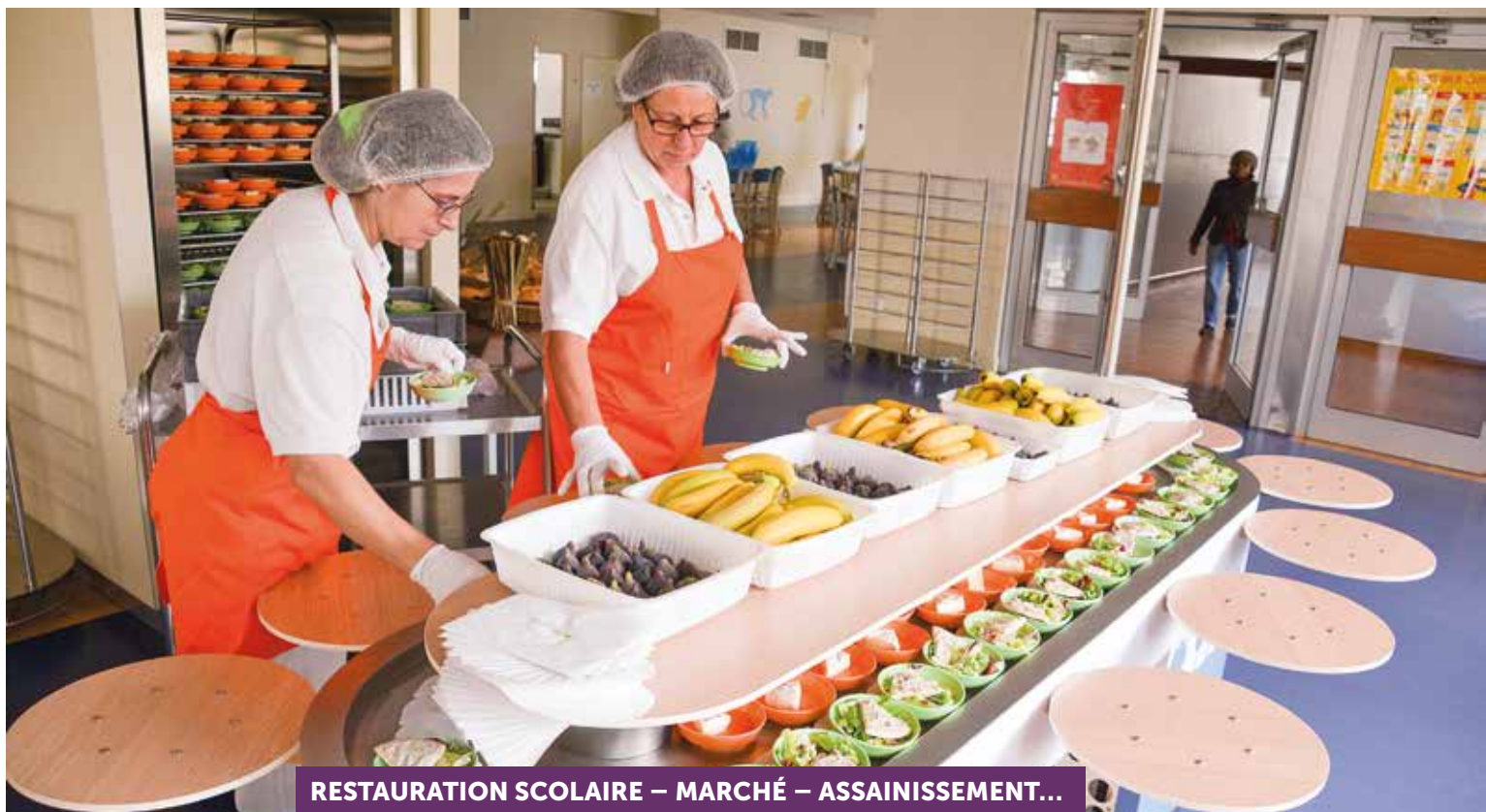
RESTAURATION SCOLAIRE – MARCHÉ – ASSAINISSEMENT...