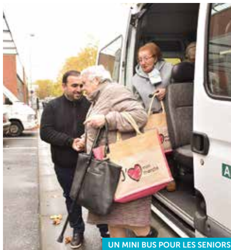
UN MINI BUS POUR LES SENIORS