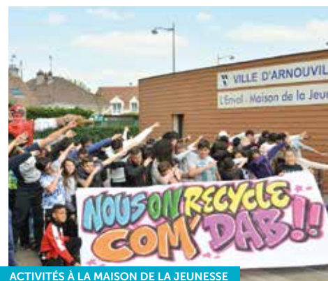
ACTIVITÉS À LA MAISON DE LA JEUNESSE