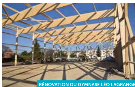
RÉNOVATION DU GYMNASÉ LÉO LAGRANGE