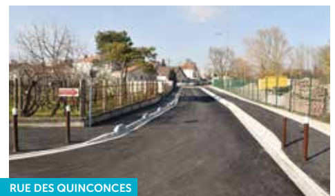
RUE DES QUINCONCES