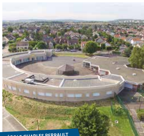
ÉCOLE CHARLES PERRAULT

10 NOUVEAUX PROJETS RÉALISÉS EN PLUS OU EN COURS