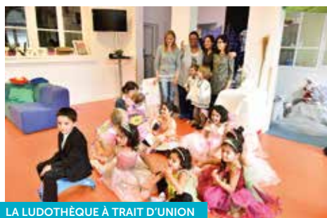
LA LUDOTHÈQUE À TRAIT D'UNION