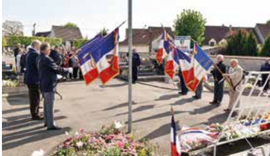
Commémoration du 8 mai 1945