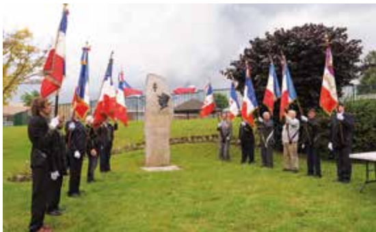
Commémoration du 18 juin