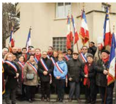
Cérémonie d'hommage à Missak Manouchian