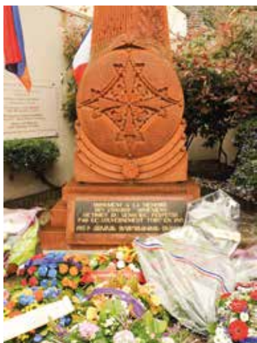
Commémoration du Génocide Arménien