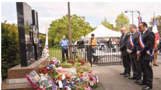
Commémoration du génocide Assyro-Chaldéen