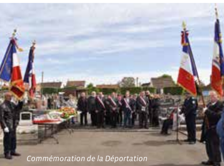
Commémoration de la Déportation