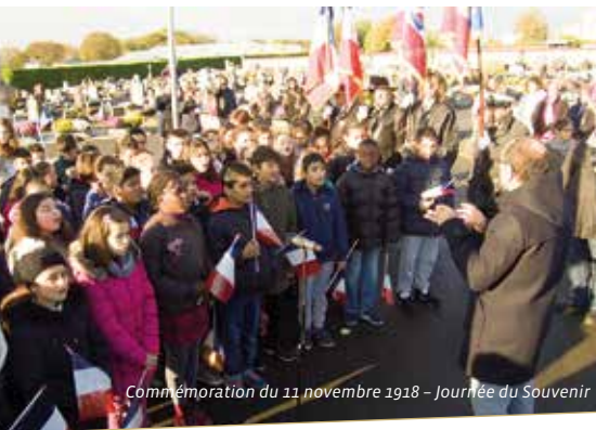
Commémoration du 11 novembre 1918 - Journée du Souvenir