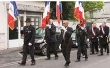
Commémoration de la Déportation