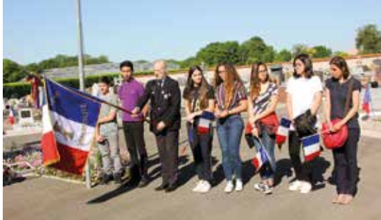
Commémoration du 8 mai 1945