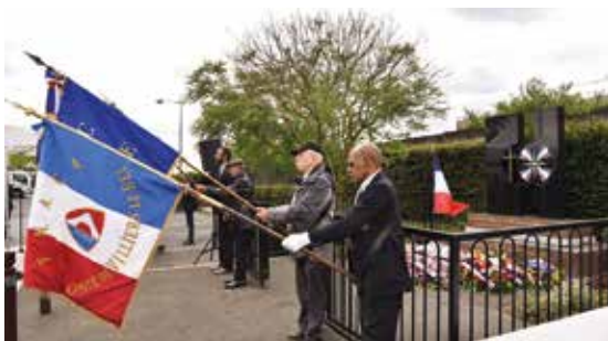
Commémoration du génocide Assyro-Chaldéen