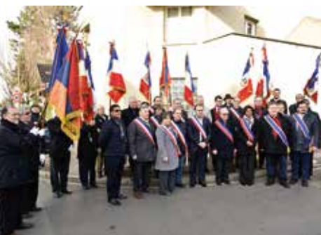
Cérémonie d'hommage à Missak Manouchian