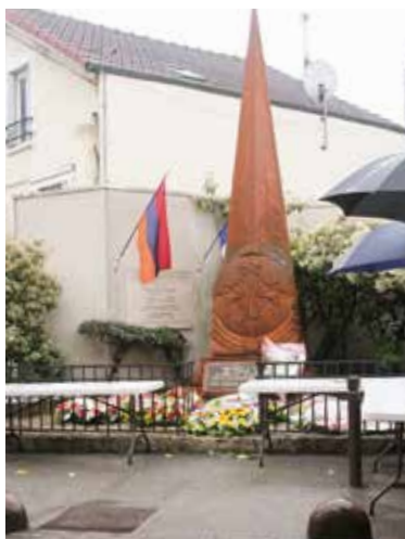
Commémoration du Génocide Arménien