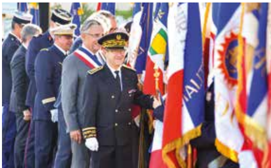
Commémoration du 18 juin