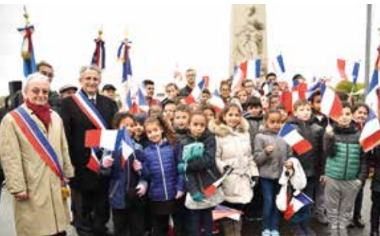
Commémoration du 11 novembre 1918 – Journée du Souvenir