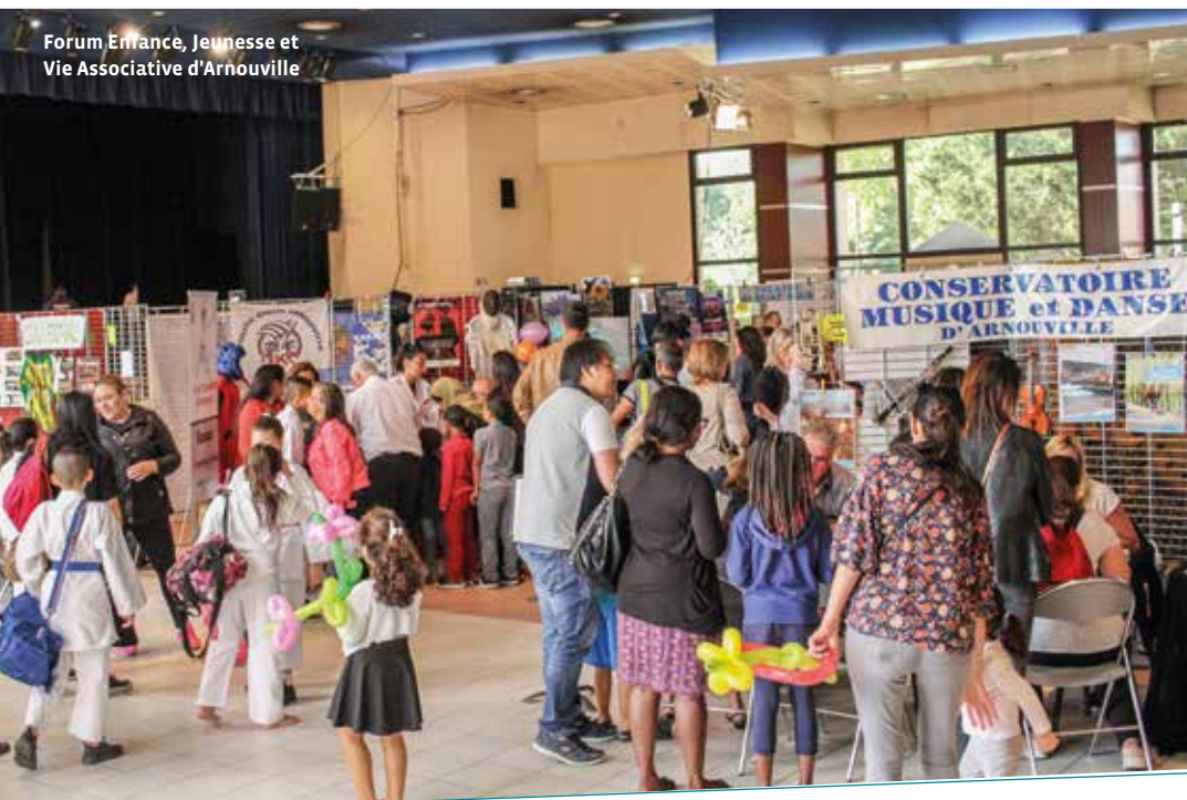
Forum Enfance, Jeunesse et Vie Associative d'Arnouville

Organisation de toute manifestation en vue de promouvoir la culture assyro-chaldéenne et de toute œuvre de bienfaisance et de service d'entraide.