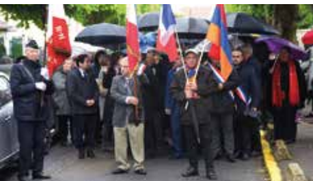
Commémoration du Génocide Arménien