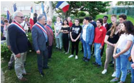
Commémoration du 18 juin