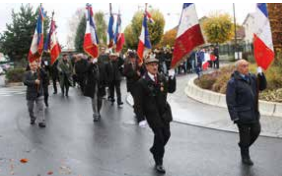
Commémoration du 11 novembre 1918 - Journée du Souvenir