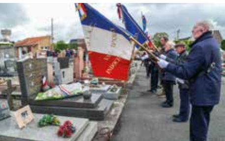
Commémoration de la Déportation