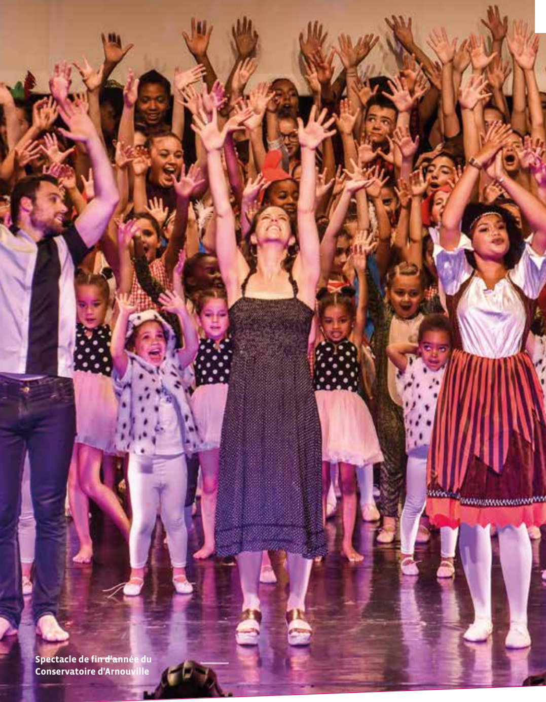
Spectacle de fin d'année du Conservatoire d'Arnouville