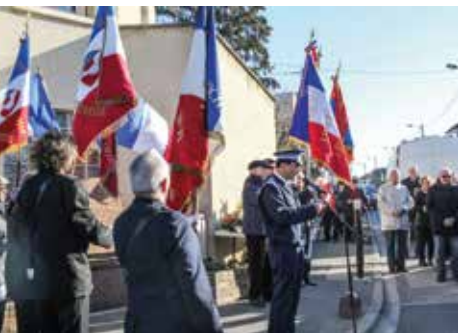
Cérémonie d'hommage à Missak Manouchian