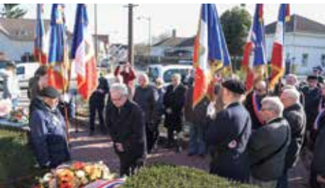
Commémoration du Cessez-le-Feu en Algérie