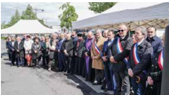
Commémoration du génocide Assyro-Chaldéen