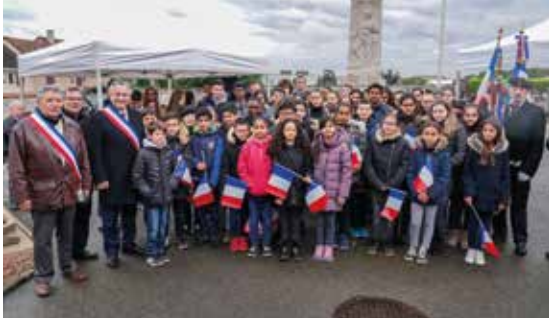
Commémoration du 8 mai 1945