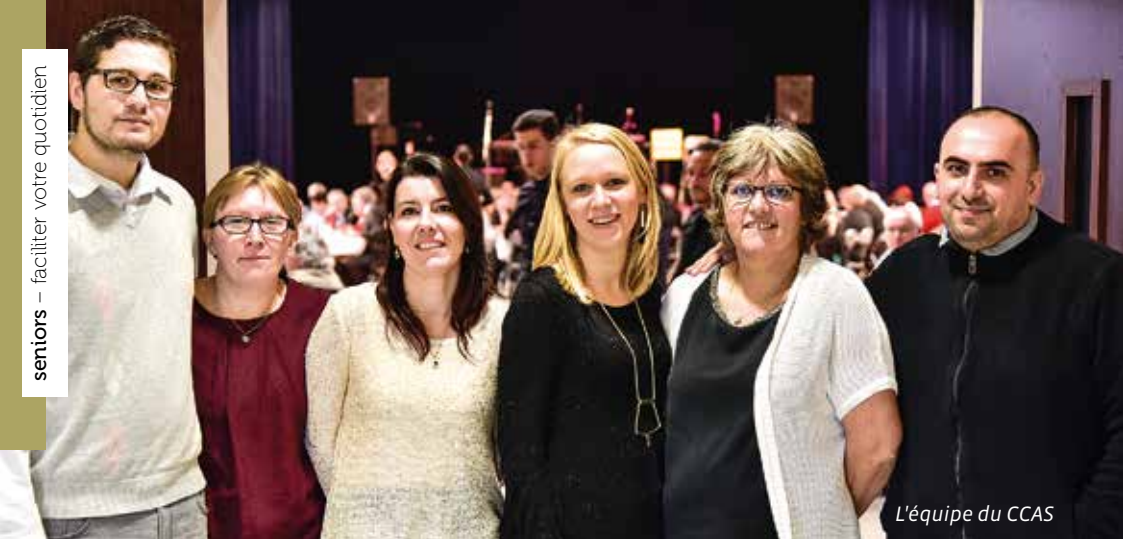
L'équipe du CCAS