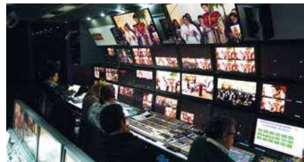
Le débat puis la messe ont été enregistrés depuis un car régie pouvant coordonner 20 caméras.