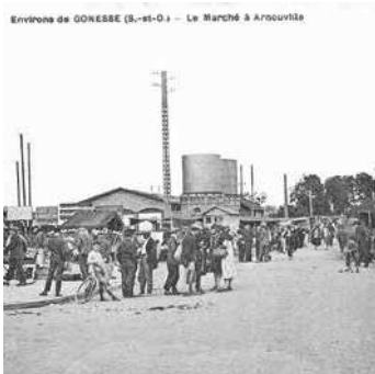
Environ de GONESSE (L-st-O) - Le Marché à Arnouville