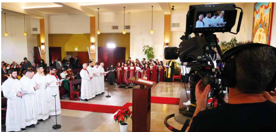
La célébration œcuménique, spécialement préparée pour l'émission par les communautés chrétiennes d'Arnouville, a été célébrée dans la plus jeune des églises de la ville, l'église Chaldéenne Saint-Jean Apôtre. Près d'un millier de fidèles a assisté à cette célébration exceptionnelle.