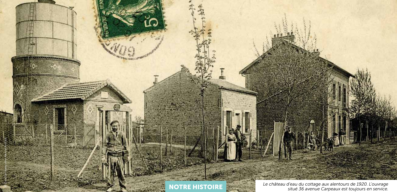
Le château d'eau du cottage aux alentours de 1920. L'ouvrage situé 36 avenue Carpeaux est toujours en service.