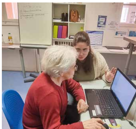
Le centre social a ouvert des ateliers numériques, notamment à destination des seniors.

Fraîchement labellisé centre social par la Caisse d'allocations familiales (CAF), Trait d'Union a fait de la lutte contre la fracture numérique l'une de ses grandes priorités. Pour répondre au mieux à ce défi, la structure a inauguré un nouvel espace entièrement dédié à accompagner et former son public. Grâce au soutien de la Préfecture du Val-d'Oise, convaincue par le dossier porté par les équipes de Trait d'Union, le centre social a pu acquérir 6 ordinateurs neufs. Surtout, la subvention de la Banque des territoires a permis le recrutement d'une médiatrice numérique, arrivée le 1 er mars dernier. Elle est en mesure d'animer des ateliers à destination des seniors et des personnes souhaitant progresser, ainsi que d'accompagner les bénéficiaires dans leurs démarches administratives en ligne. L'animatrice aura en plus l'opportunité de participer à des cafés numériques organisés par la Préfecture afin de développer ses compétences et de s'adapter au mieux