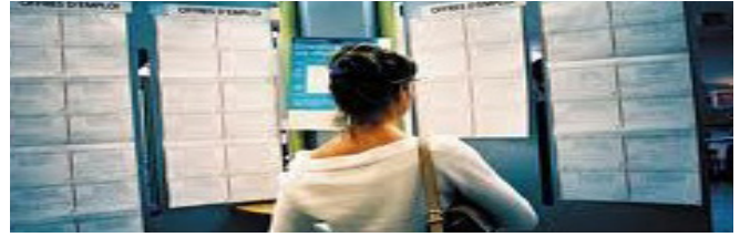
Exemple d'une annonce :

En cas de difficulté pour figurer sur ce site, vous pouvez contacter Sylviane SZALENIEC par mail : mon-enfant.cafcergy@caf.cnafmail.fr ou par téléphone au 01 30 73 63 01 les lundis, mardis et jeudis.